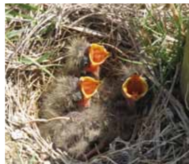
エサをおねだりするヒナ鳥

桜の支柱の足元に巣があり、大きな口を開けてエサのおねだりです。ゴールデンウィーク中でもあり、間近に小鳥のヒナを見ることのない子どもたちは大喜びです。生命の誕生に感激してくれたことでしょうか。